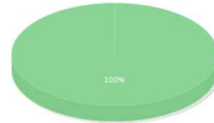
Porcentaje de concordancia en el diagnóstico